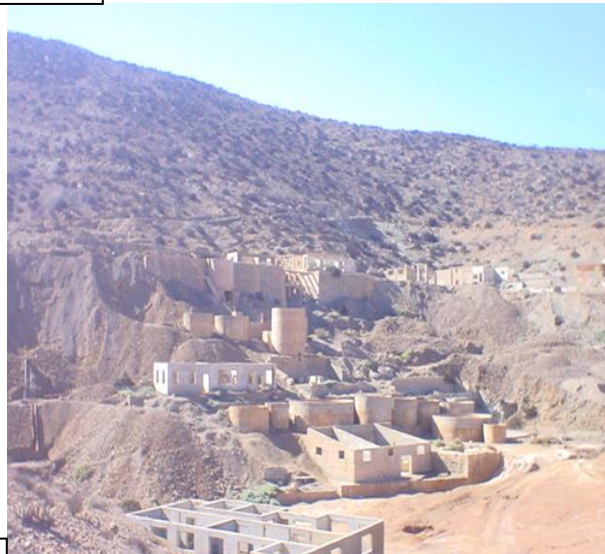
Vista general Mineral de Capote