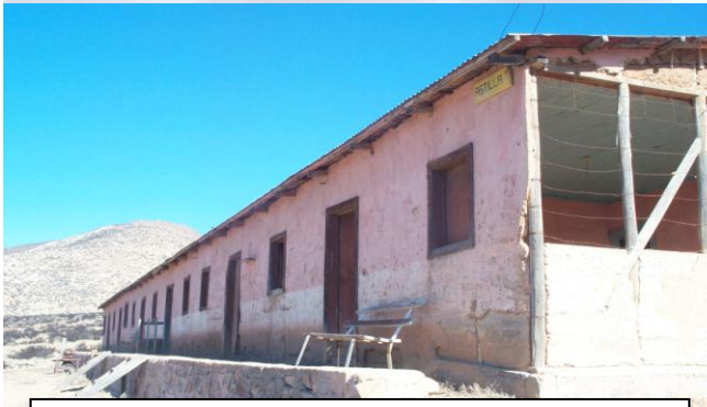
Estado de viviendas de Mineral Astillas.

RECOMENDACIONES: Llevar combustible suficiente, colación para el día y en lo posible solicitar servicio de guías en Oficina de Información Turística, en Plaza de Freirina.