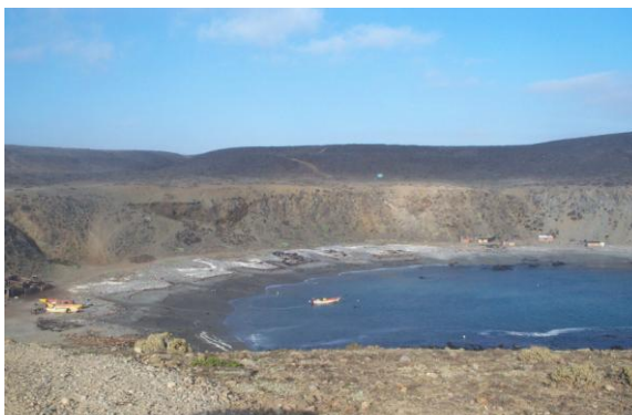
Vista sector “Agua de la Zorra”