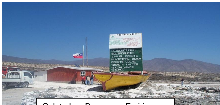
Caleta Los Bronces – Freirina.

Recomendable es tomar un guía (Oficina Información Plaza).